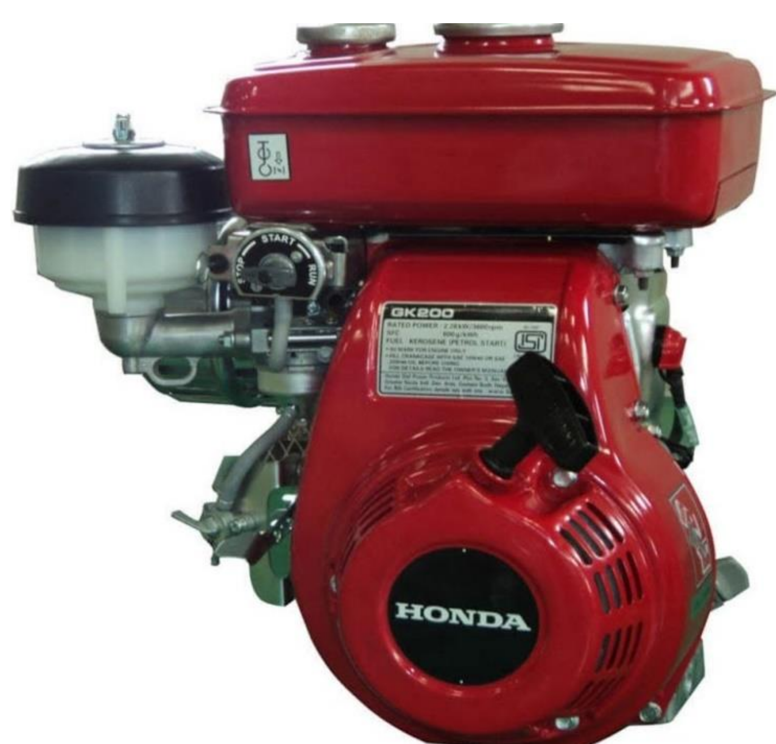
HONDA GK 200